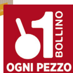
RT# VINO BRIK BIANCO/ ROSSO/ROSA TO LT.1