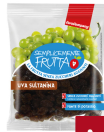
EUROCOMPANY UVA SULTANINA G.250