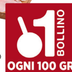
ROSSOTONO PROSCIUTTO COTTO A.Q.

REGOLAMENTO: Dal 24 novembre 2025 al 14 febbraio 2026 ricevi 1 bollino ogni 15€ di spesa (scontrino unico, multipli inclusi). Accelera la tua raccolta acquistando i prodotti sponsor. Raggiungi la soglia minima di 15€ di spesa, per ogni prodotto sponsor acquistato riceverai un bollino in più! I prodotti sponsor saranno debitamente segnalati in punto vendita. Incolla i bollini sull'apposita scheda e, raggiunto il numero necessario, richiedi il premio scelto aggiungendo il contributo corrispondente. Potrai richiedere il tuo premio fino al 28 febbraio 2026.