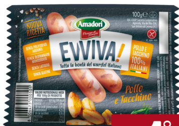
AMADORI EVVIVA WURSTEL POLLO E TACCHINO G.100 PZ.4