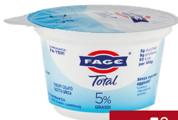
FAGE TOTAL YOGURT VARI TIPI G.150