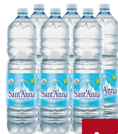
SANT'ANNA ACQUA LT.1,5X6