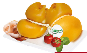
SANGUEDOLCE AFFUMICATI G.400