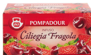
POMPADOUR INFUSO VARI TIPI 20 FILTRI