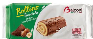
BALCONI ROLLINO VARI TIPI X6 G.222