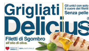
DELICIUS FILETTI DI SGOMBRO GRIGLIATI/ NATURALE O.O. G.90