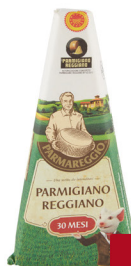
PARMAREGGIO PARMIGIANO REGGIANO DOP SPICCHIO G.250