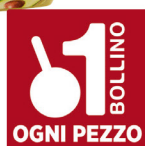
NOA HUMMUS CECI E AVOCADO G.175