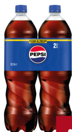
PEPSI CLASSICA/ZERO LT.1,5 X2