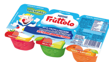
NESTLE FRUTTOLO VARI TIPI G.300