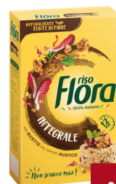
FLORA RISO INTEGRALE KG.1