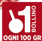
VERONI PROSCIUTTO COTTO SCELTO