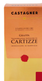
CASTAGNER GRAPPA CARTIZZE INVECCHIATA 12 MESI CL.50