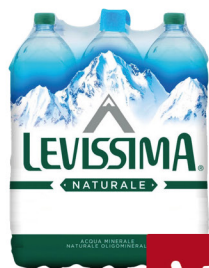
LEVISSIMA NATURALE LT.2X6