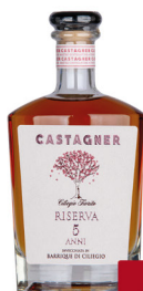
CASTAGNER GRAPPA CILIEGIO 5 ANNI CL.35