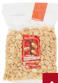
EUROCOMPANY ARACHIDI TOSTATE E SALATE GR 250