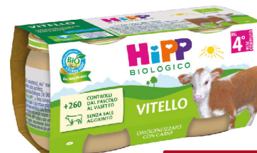
HIPP OMOGENEIZZATO CARNE VARI TIPI GR 80X2