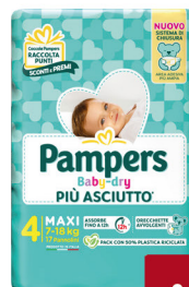
PAMPERS BABY DRY DOWNCOUNT VARIE TAGLIE