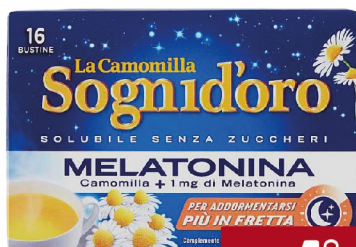
STAR SOGNI D'ORO CAMOMILLA MELATONINA SOLUBILE 16 BS S/ZUCCH