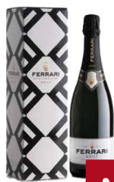
FERRARI SPUMANTE BRUT CL.75 ASTUCCIATO