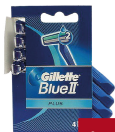
GILLETTE BLUE II CLASSICO X5/PLUS/ SLALOM X4