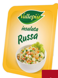
VALLEPIU' INSALATA RUSSA G.200