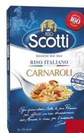
SCOTTI RISO CARNAROLI KG.1