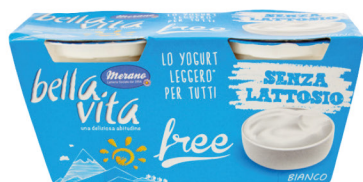
MERANO YOGURT BELLA VITA FREE SENZA LATTOSIO G.125X2