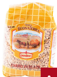
PEDON FARRO PERLATO G.500