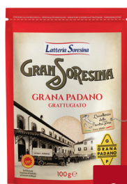
SORESINA GRANA PADANO DOP GRATTUGIATO BUSTA G.100