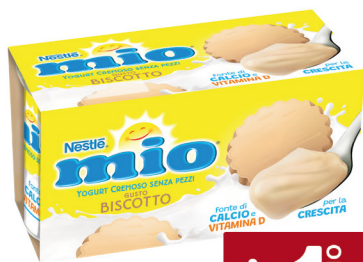
NESTLE YOGURT MIO VARI GUSTI G.125X2