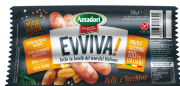
AMADORI EVVIVA WURSTEL POLLO E TACCHINO G.250 PZ.3