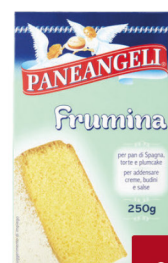
PANEANGELI AMIDO FRUMENTO G. 250