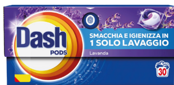
DASH PODS VARI TIPI X30