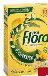
FLORA RISO CLASSICO KG.1