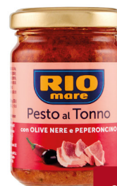
RIOMARE PESTO VARI TIPI GR130