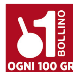
SENFTER SPECK MONTAGNA