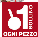
LAGO WAFER MULTIPACK CACAO/NOCCIOLA G.50 X4