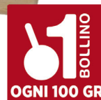
CAROZZI TALEGGIO DOP CLASSICO