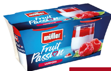
MULLER FRUIT PASSION VARI TIPI G.125X2