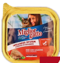
MORANDO MIGLIOR GATTO PATE' VASCH. VARI TIPI G.100