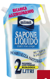
MIL MIL SAPONE LIQUIDO BUSTA MAXI RICARICA VARI TIPI LT.2