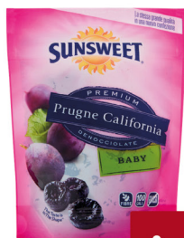
SUNSWEET PRUGNE DENOCCIOLATE/ CON NOCCIOLO G.250