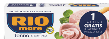
RIO MARE TONNO NATURALE G.80X2+1