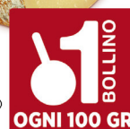
BAYERNLAND FORMAGGIO PAMIGO STAGIONATO