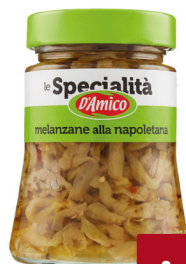
D'AMICO FILETTI MELANZANE ALLA NAPOLETANA IN OLIO EVO G.280