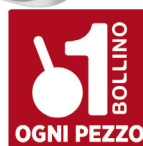
EXQUISA FORMAGGIO FRESCO CREMOSO CLASSICO G.175