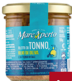
MAREAPERTO FILETTI TONNO VARI TIPI GR.150