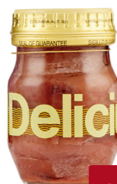
DELICIUS FILETTI DI ALICI TESI G.90