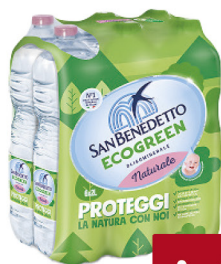
SAN BENEDETTO ACQUA NATUR. LT.2X6