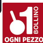
BOTTE BUONA ROSSO/ BIANCO D'ITALIA CL.75