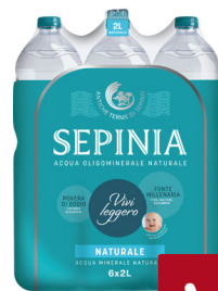
SEPINIA ACQUA NATURALE LT.2X6