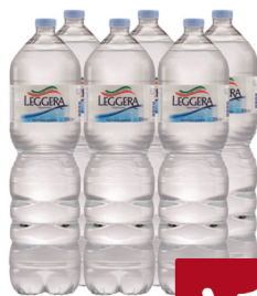
LEGGERA ACQUA NATURALE LT.2X6