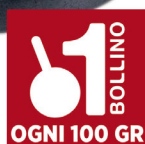
MOTTOLINI FIOCCO DI PROSCIUTTO