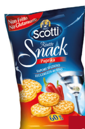
SCOTTI RISO SNACK PAPRIKA/ERBE FINI G.60