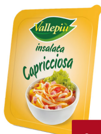
VALLEPIU' INSALATA CAPRICCIOSA G.200