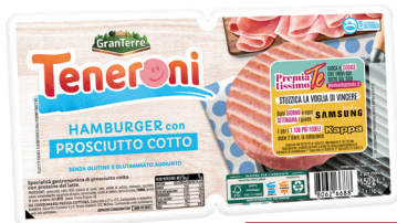
TENERONE HAMBURGER DI PROSCIUTTO COTTO/ MOZZARELLA G.150