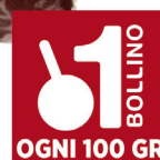
ROSSOTONO PANCETTA SUPERCOPPATA