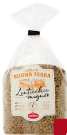
PEDON LENTICCHIE MIGNON/ROSSE G.500