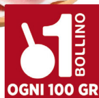
FERRARINI PROSCIUTTO COTTO EFTE ALTA QUALITA'