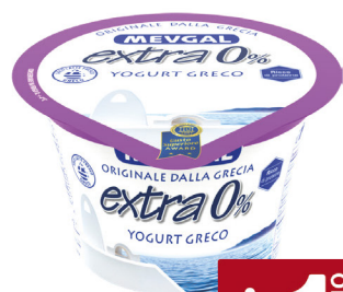
MEVGAL YOGURT GRECO EXTRA 0%/EXTRA/2% DI GRASSI G.150