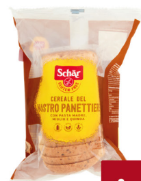
SCHAR PANE CEREALE G.330 MASTRO PANETTIERE A FETTE S/ GLUT.