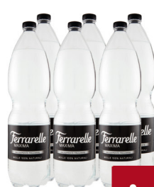
FERRARELLE MAXIMA LT.1,5X6