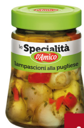
D'AMICO LAMPASCONI ALLA PUGLIESE IN OLIO EVO G.290