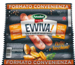
AMADORI EVVIVA WURSTEL POLLO E TACCHINO G.500