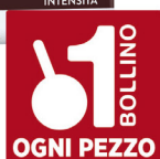
KIMBO MACINATO FRESCO G.250X2