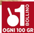
VALGRANA FORMAGGIO FORME SCELTO STAG. 16 MESI OLTRE KG.34