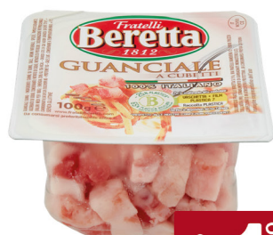
BERETTA CUBETTI DI GUANCIALE G. 100