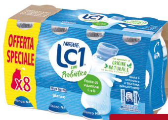
NESTLE LC1 VITAL VARI TIPI G.90X8