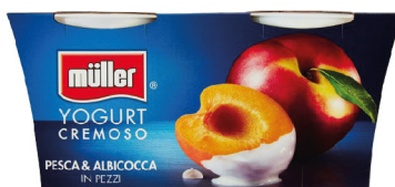
MULLER CREMA YOGURT VARI TIPI G.125X2