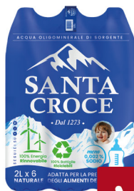
SANTA CROCE LT.2X6