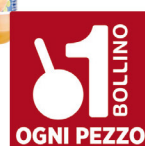
SANTAL SUCCO VARI TIPI ML.250