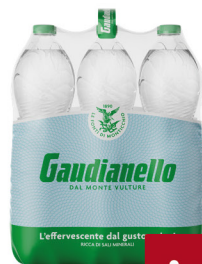
GAUDIANELLO EFF. NATUR. LT.1,5X6