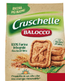
BALOCOCCO BISCOTTI CLASSICI VARI TIPI GR 700