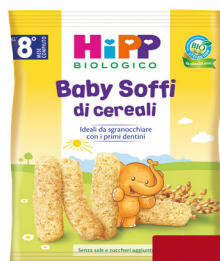
HIPP BABY SNACK VARI TIPI GR 30