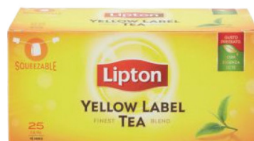
LIPTON TEA YELLOW LABEL 25F SQUEEZABLE