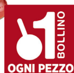
MUTTI PASSATA GR.235