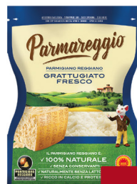
PARMAREGGIO PARMIGIANO REGGIANO DOP GRATTUGIATO G.60