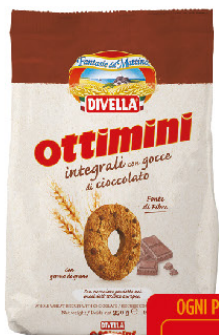
DIVELLA OTTIMINI INTEGRALI C/GOCCE CIOCCOLATO G.350