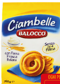
BALOCCO CIAMBELLE G.700CLASSICI C/ OLIO GIRAS.