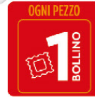
MULLER MIX G.150 FRAGOLE