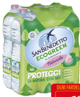
SAN BENEDETTO ACQUA NATUR.LT.2 X6