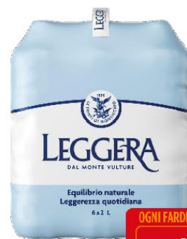
LEGGERA ACQUA NATURALE LT.2 X6