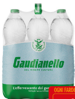
GAUDIANELLO EFF. NATURAL.LT.1,5 X6