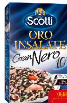
SCOTTI ORO INSALATE GR.800 RISO VENERE