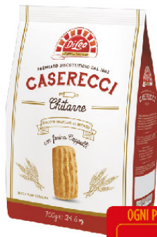
DILEO BISCOTTI CASERECCI CHITARRE GR.700