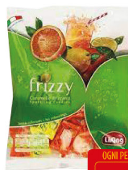
LIKING CARAM.T220 FRIZZY AR/LI