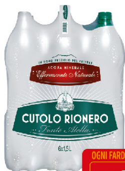
CUTOLO ACQUA EFF. NATUR.LT.1,5 X6