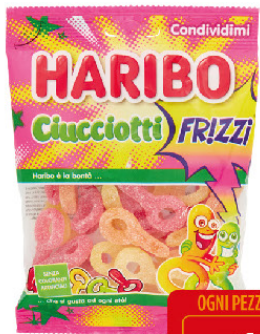
HARIBO G.175 FRIZZI CIUCCIOTTI BS. -GOMMOSE-