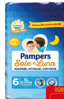
PAMPERS SOLE E LUNA XL X13 KG. 15-30 PANNOLINI