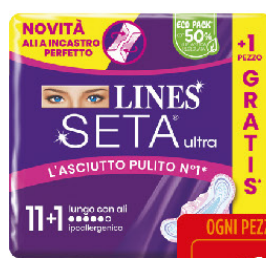
LINES SETA ULTRA LUNGO ALI X11+1