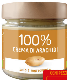
EUROCOMPANY CREMA PURA 100% DI ARACHIDI TOSTATE BIO GR.175