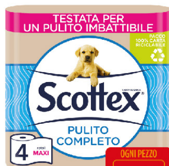
SCOTTEX CARTA IGIEN X4 MAXI ROTOLO PULITO COMPLETO ECO