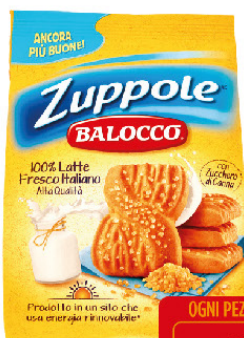
BALOCCO ZUPPOLE G.700 CLASSICI C/ OLIO GIRAS.