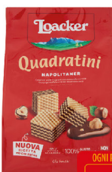
LOACKER QUADRI' NAPOLIT.G.250