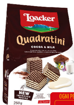
LOACKER QUADRI' CACAO&MILKG.250