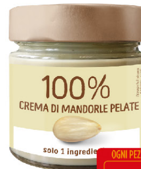
EUROCOMPANY CREMA MANDORLA PELATA BIO PURA 100% GR.175