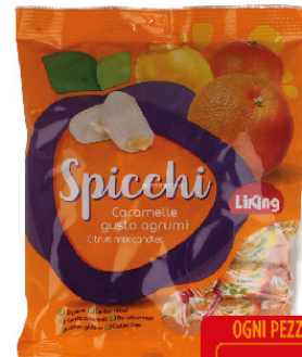
LIKING CARAM.T220 SPICCHI RIP.