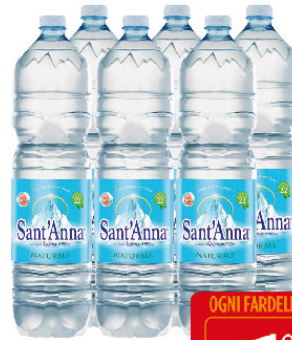
SANT'ANNA ACQUA NATURALE LT.1,5 X6