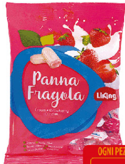
LIKING CARAM.T220 PANNAFRAGOLA RIPIENE