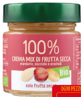
EUROCOMPANY CREMA DI MISTO FRUTTA SECCA CREMA PUR 100% GR.175