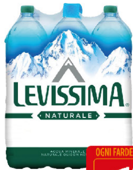
LEVISSIMA NATURALE LT.2 X6