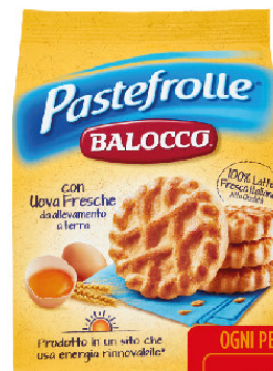
BALOCCO PASTEFROLLE G.700. CLASSICI C/OLIO GIRASOLE