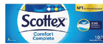
SCOTTEX FAZZOLETTI X10