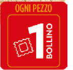
MULLER MIX G.150 SORPRENDENTE