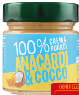
EUROCOMPANY CREMA DI ANACARDI E COCCO CREMA PUR 100% GR.175