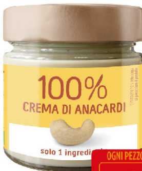
EUROCOMPANY CREMA 100% DI ANACARDI BIO GR.175