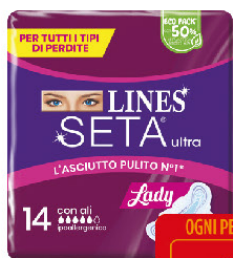
LINES SETA ULTRA LADY ALI X14