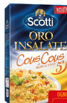
SCOTTI RISO ORO INSALATE COUS COUS G.800 AST.