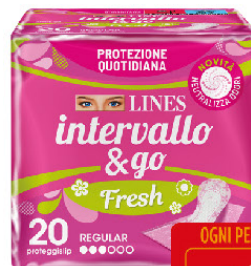
LINES INTERV. FRESH RIP. 20