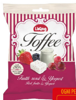
LIKING CARAM. G.175 TOFFEE FR/ROSSI E YOGURT