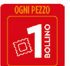
MERANO YOG.BELLA VITA FREE SENZA LATTOSIO G.125X2 CILIEGIA