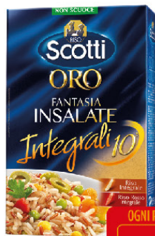
SCOTTI ORO FANT. DI INSALATE INTEGRALI GR.850