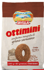
DIVELLA OTTIMINI GRANO SARACENO G.300+50