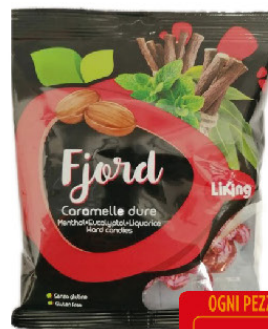
LIKING CARAM.T220 FJORD BALS.