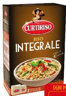
CURTIRISO RISO INTEGRALE KG.1 PAR-BOILED