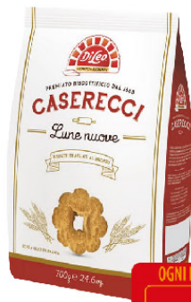
DILEO BISCOTTI CASERECCI LUNENUOVE GR.700