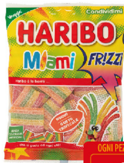
HARIBO FRIZZI MIAMI G.175