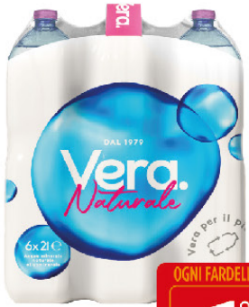
VERA ACQUA NATURALE LT.2 X6