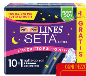
LINES SETA ULTRA NOTTE ALI X10+1