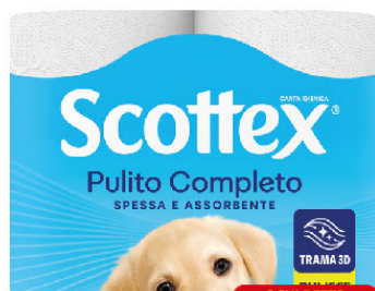
SCOTTEX CARTA IGIEN X4 MAXIRO-TOLO PULITO COMPLETO