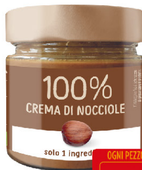
EUROCOMPANY CREMA DI NOCCIOLE-PELATE TOSTATE BIO 100% GR.175