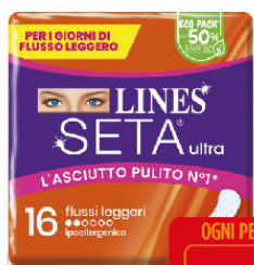
LINES SETA ULTRA FLUSSO LEGGERO X16