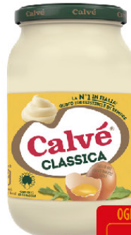
CALVE' MAIONESE CLASSICA VASOML.650