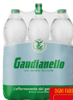
GAUDIANELLO EFF. NATURAL.LT.1,5 X6