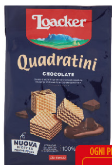
LOACKER QUADRI' CACAO G.250