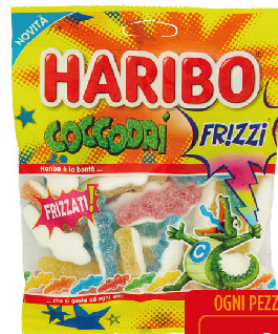
HARIBO FRIZZI COCODRI' G.175 -GOMMOSE-