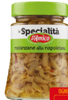
D'AMICO FILETTI MELANZANE NAPOL. IN OLIO EX.VERG. G.280