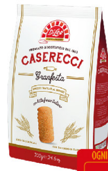
DILEO BISCOTTI CASERECCI GRANFESTA GR.700