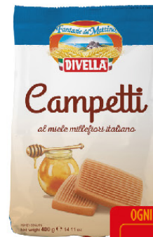
DIVELLA CAMPETTI C/ MIELE G.400