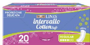
LINES INTERV. FRESH DIST. 20 0