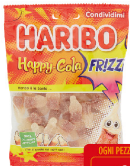
HARIBO G.175 FRIZZI HAPPY LEMON FRESH COLA -GOMMOSE-