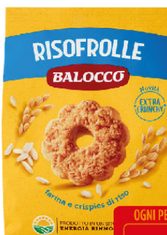
BALOCCO RISOFROLLE GR.700 CLASSICI - C/OLIO GIRASOLE