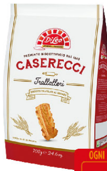
DILEO BISCOTTI CASERECCI TRALLALLERI GR.700